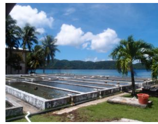
シャコ貝の養殖場