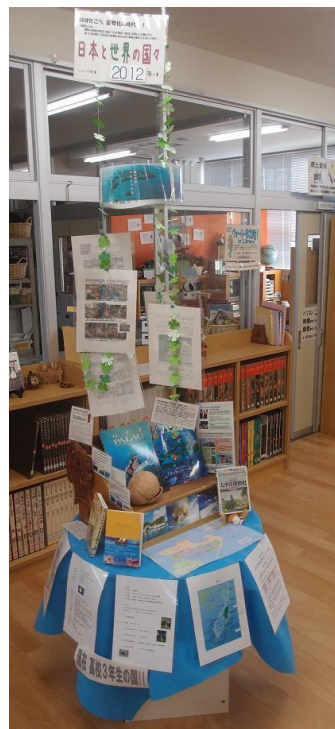
帰国後、勤務先の図書館に展示