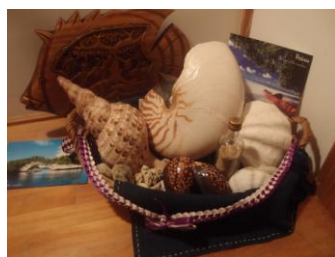
いただいたお土産