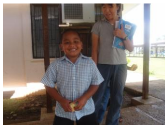
JICA の派遣教師と現地の子