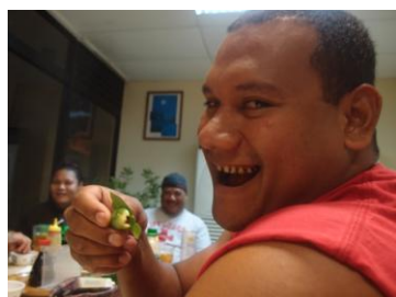
ピンロー好きの人